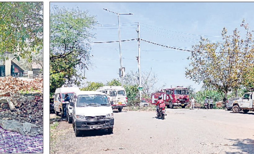
सोनीपत। टॉवर के पास खड़ी फायर ब्रिगेड की गाड़ी व पंपुलेंस।