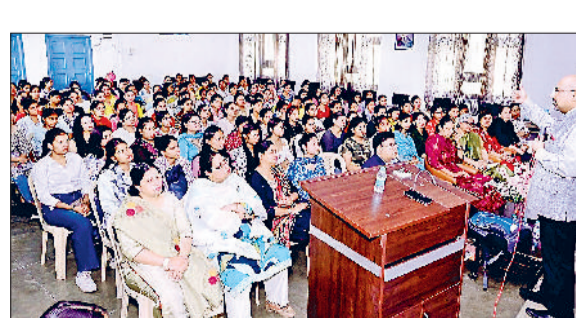
सोनीपत। सेमिनार के दौरान उपस्थित स्टाफ एवं संबोधित करते हुए वक्ता।

टीका राम कन्या महाविद्यालय में उच्च शिक्षा और करियर संभावनाओं विषय पर एक महत्वपूर्ण सेमिनार का आयोजन किया गया। इस कार्यक्रम का आयोजन प्लेसमेंट प्रकोष्ठ, करियर काउंसलिंग सेल और विश्वविद्यालय आउटरीच प्रकोष्ठ के संयुक्त सहयोग से किया गया। सेमिनार में स्नातक एवं स्नातकोत्तर की छात्राओं ने उत्साहपूर्वक भाग लिया। कार्यक्रम