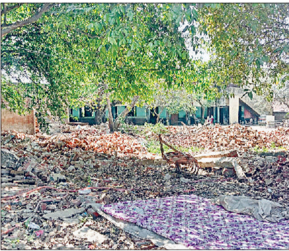
सोनीपत। असावरपुर में प्रशासन की ओर से बुलडोजर से गिराए गए स्कूल के कम्बरे।