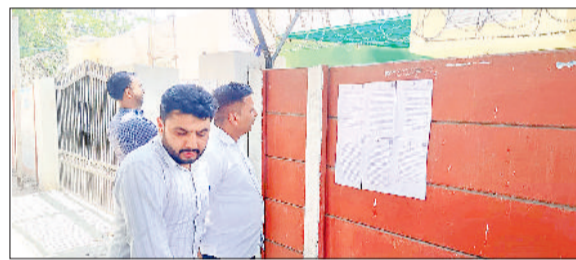
गन्नौर। बीएसटी कॉलोनी में नोटिस लगाती आधिकारिक लिक्विडेटर की टीम।

दिल्ली हाई कोर्ट के आदेश के बाद गन्नौर स्थित भारत स्टील ट्यूब्स लिमिटेड (बीएसटी) कॉलोनी में अवैध रूप से रह रहे लोगों में हड़कंप मच गया है। कोर्ट ने कंपनी के क्वार्टरों पर कब्जा जमाए बैठे लोगों को निर्धारित समय सीमा के भीतर मकान खाली करने के निर्देश दिए हैं। साथ ही जिन पूर्व श्रमिकों को उनका बकाया भुगतान मिल चुका है, उन्हें भी मकान खाली करना होगा। जानकारी के अनुसार भारत स्टील ट्यूब्स लिमिटेड को इकाई वर्ष 1988 में बंद हो गई थी, जबकि 2003 में न्यायालय ने इसे परिसमापन में भेज दिया था। कंपनी पर बैंकों और कर्मचारियों का बकाया होने के