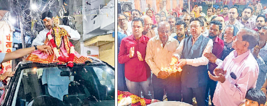
सोनीपत। हलवाई हट्टा स्थित मंदिर से माता रानी को रामलीला मैदान स्थित मेला स्थल ले जाते श्रद्धालु और पूजा करते भक्त।

विभिन्न प्रदेशों से श्रद्धालुओं ने माता रानी के दर्शन कर पूजा-अर्चना कर मन्नतें मांगीं। मेले में सुबह ही भक्तों की भीड़ लगनी शुरू हो गई थी। दिनभर मेला स्थल पर श्रद्धालुओं व