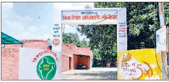
सोनीपत। सेक्टर-14 स्थित जिला शिक्षा विभाग का कार्यालय।

आर्थिक अभाव के चलते शिक्षा से वंचित रूपी अधिकांश में डोल रहे बच्चों को उम्मीदों का चिराग मिल सकेगा। ऐसे में आर्थिक रूप से कमजोर परिवारों के बच्चे अब मनपसंद निजी विद्यालयों में शिक्षा ग्रहण कर सकेंगे। मौलिक शिक्षा निदेशालय के निर्देश पर शैक्षणिक सत्र 2026-27 के लिए चिराग योजना के तहत सोनीपत के 61 निजी स्कूलों सहित प्रदेश के 1108 स्कूलों ने विभाग के पोर्टल व वेबसाइट पर अपनी सीटों का विवरण दर्ज कर दिया है। अब योजना के तहत कक्षा छठी से 12वीं तक के विद्यार्थी आवेदन कर अपने मनपसंद निजी स्कूलों में दाखिला लेकर शिक्षा ग्रहण कर सकेंगे। इस साल प्रदेश के 22 जिलों में जहां योजना के तहत 47255 सीटों, तो वहीं सोनीपत में 2156 सीटों को आरक्षित रखा गया है। इन सभी सीटों पर विद्यार्थियों को निजी स्कूलों में निशुल्क दाखिला दिया जाएगा।