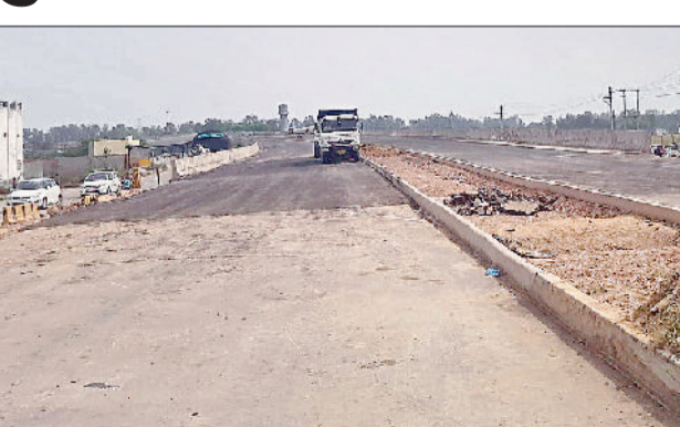
सोनीपत। ग्रीनफील्ड राष्ट्रीय राजमार्ग (एनएच)-352ए से गुजरते वाहन।

गए। पीड़ित के अनुसार एजेंसी ने रकम वसूलने के लिए अलग-अलग तरीके अपनाए। पहले फाइल शुरू करने के नाम पर छोटी राशि ली गई, फिर अग्रिम भुगतान के रूप में बड़ी रकम जमा कराई गई। इसके बाद सुरक्षा राशि, दूतावास शुल्क, साक्षात्कार और बायोमेट्रिक प्रक्रिया के नाम पर बार-बार पैसे मांगे गए। हर बार यह कहा गया कि प्रक्रिया अंतिम चरण में है और भुगतान न करने पर वीजा रद्द हो जाएगा।